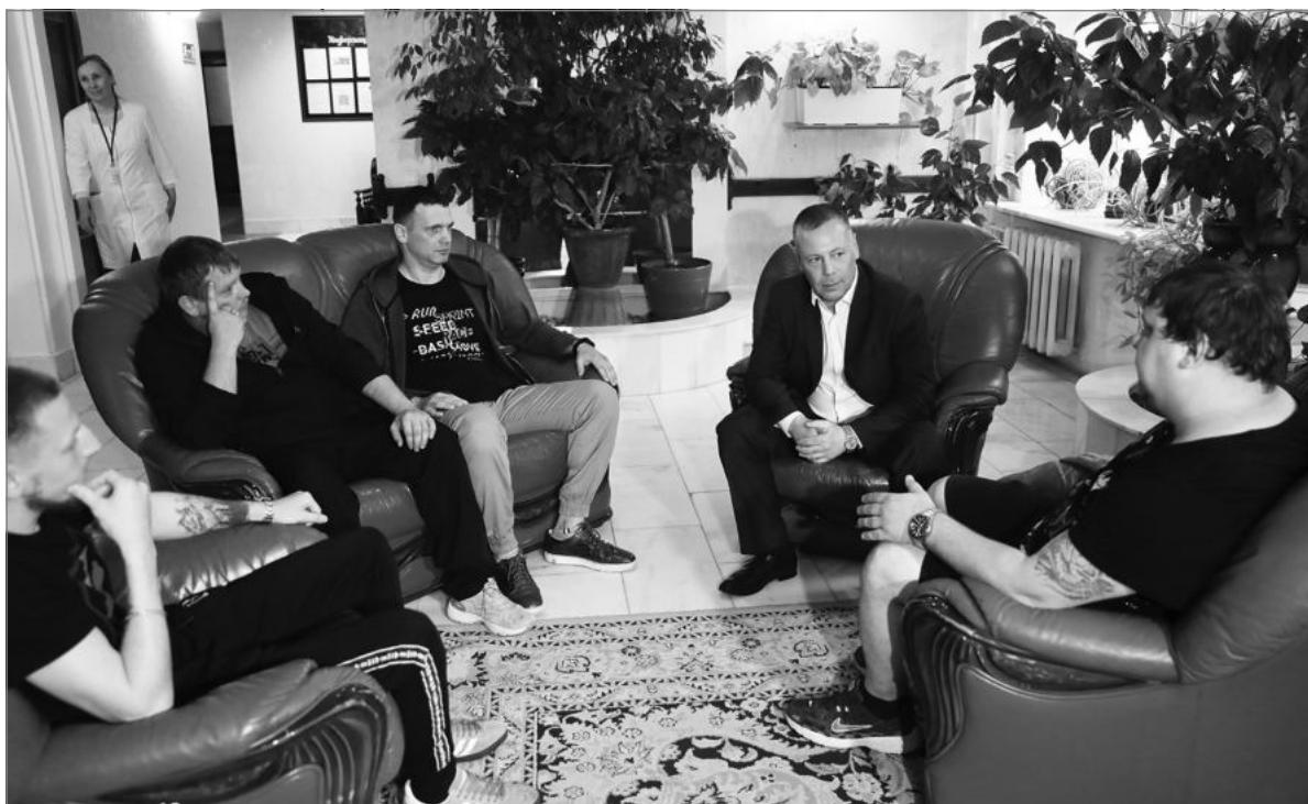
Губернатор Михаил Евраев и участники СВО

Также с 1 июня в рамках работы регионального отделения фонда «Защитники Отечества», созданного Правитель-